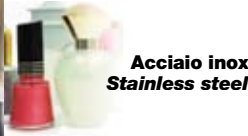
Acciaio inox Stainless steel