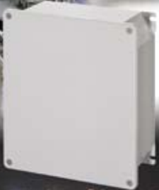
Cassette per derivazione Junction boxes