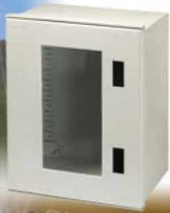
Quadri in poliestere Polyester boxes